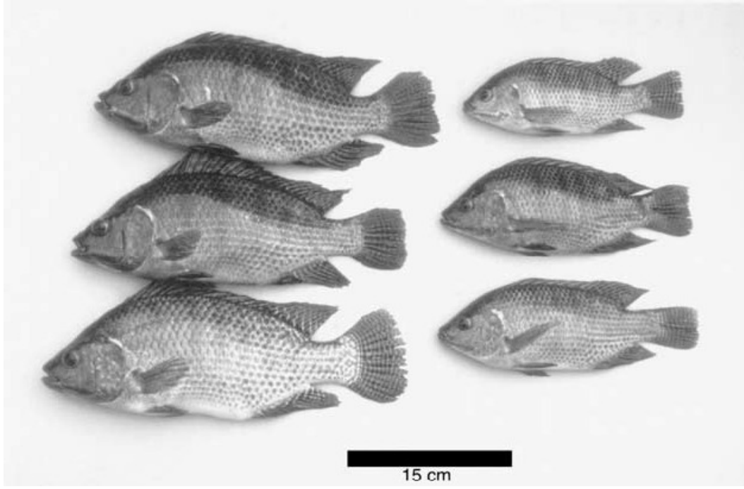
Şekil 1. Aynı yaştaki GH kodlayan gen transfer edilmiş transgenik tilapia (solda) ve transgenik olmayan tilapia (sağda) (Rahman ve ark., 2001)